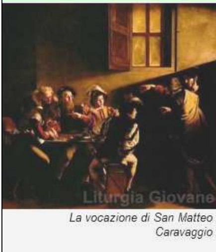
Liturgia Giovane La vocazione di San Matteo Caravaggio

Penultima Domenica dopo l'Epifania - Anno C